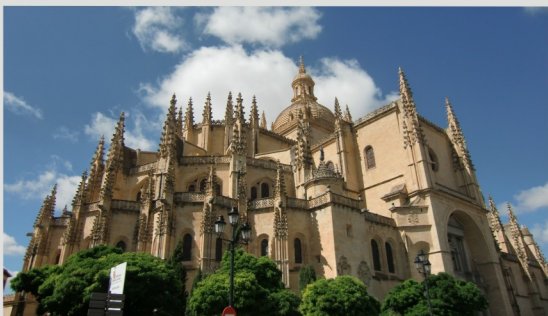
Catedral de Segovia, construida con materiales pétreos naturales.